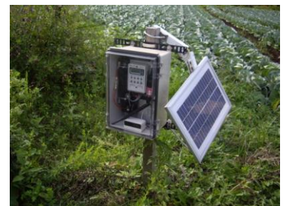
Fig : 現場での最小構成)